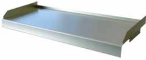
Raccord au béton apparent